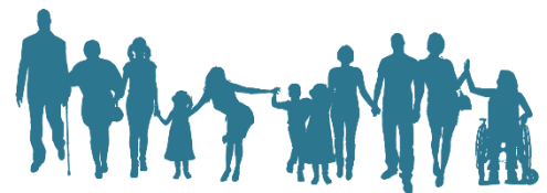
HOSPIZGRUPPE Aschaffenburg e.V.

Sterben müssen wir alle - die Frage ist nur wann und wie? Die Hospizgruppe Aschaffenburg bietet die Beratung und Begleitung von unheilbar erkrankten und sterbenden Menschen und deren Angehöriger. Die ehrenamtlichen Hospizbegleiter unterstützen dabei in vertrauter Umgebung, unter Achtung der persönlichen Bedürfnisse und Wünsche. Sie leisten Lebensbeistand bis zuletzt. Unterstützung zur richtigen Zeit am richtigen Ort. www.hospizgruppe-aschaffenburg.de